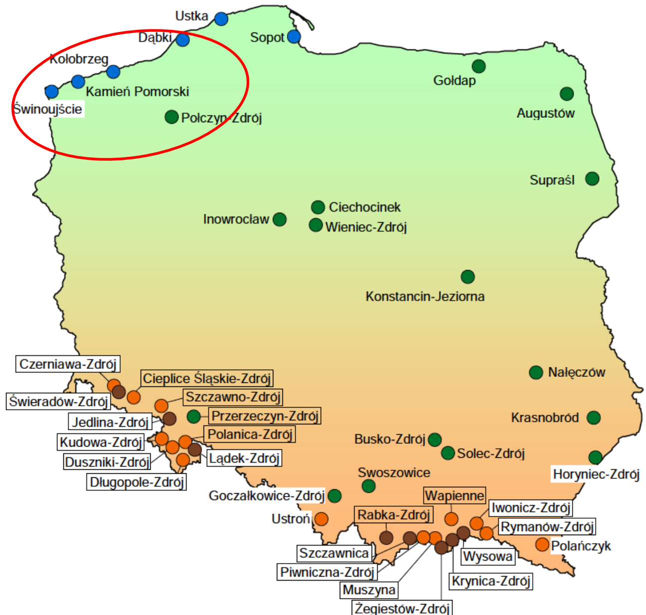
SCHEMAT ROZMIESZCZENIA MIEJSCOWOŚCI UZDROWISKOWYCH