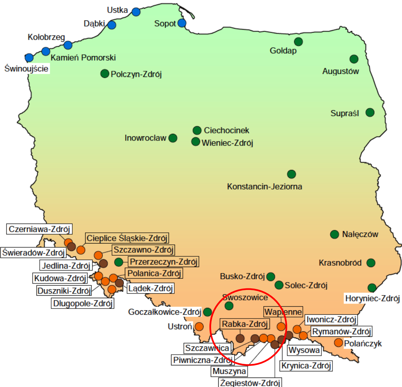
SCHEMAT ROZMIESZCZENIA MIEJSCOWOŚCI UZDROWISKOWYCH