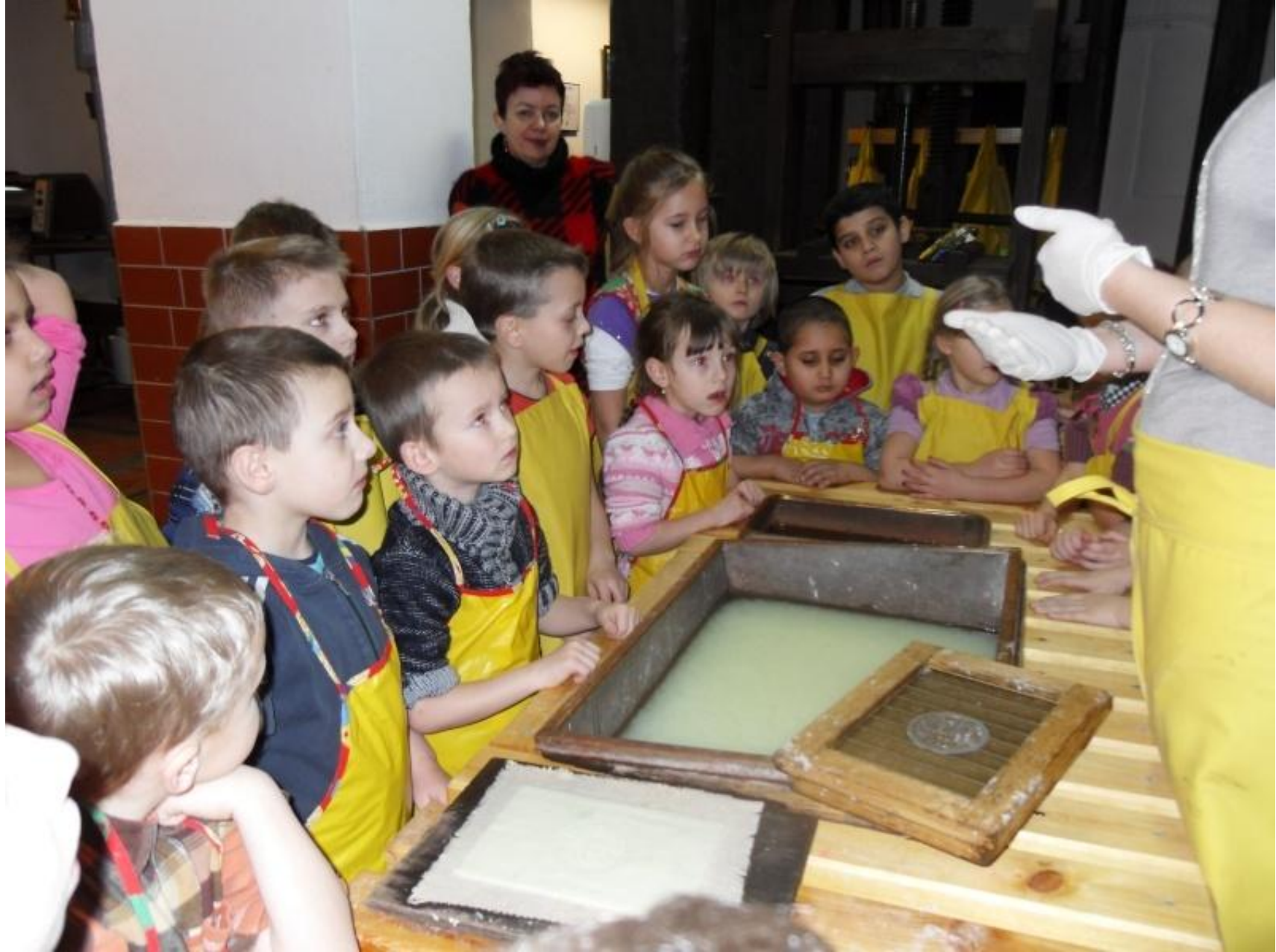
Czerpanie papieru w muzeum papiernictwa w Dusznikach