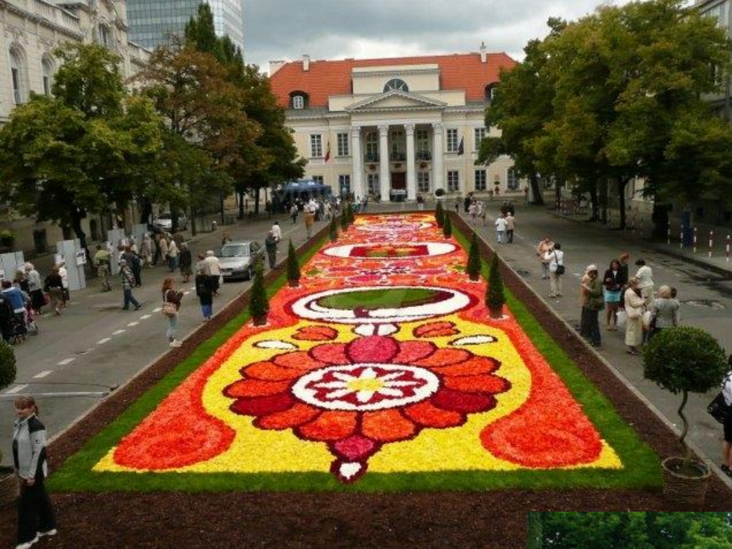
Dywany kwiatowe w Ciechocinku