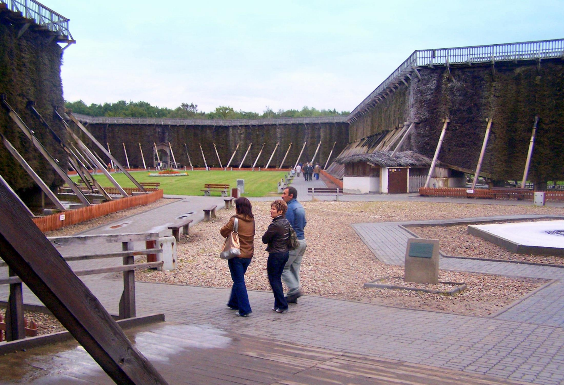
Teznie w Inowrocławiu