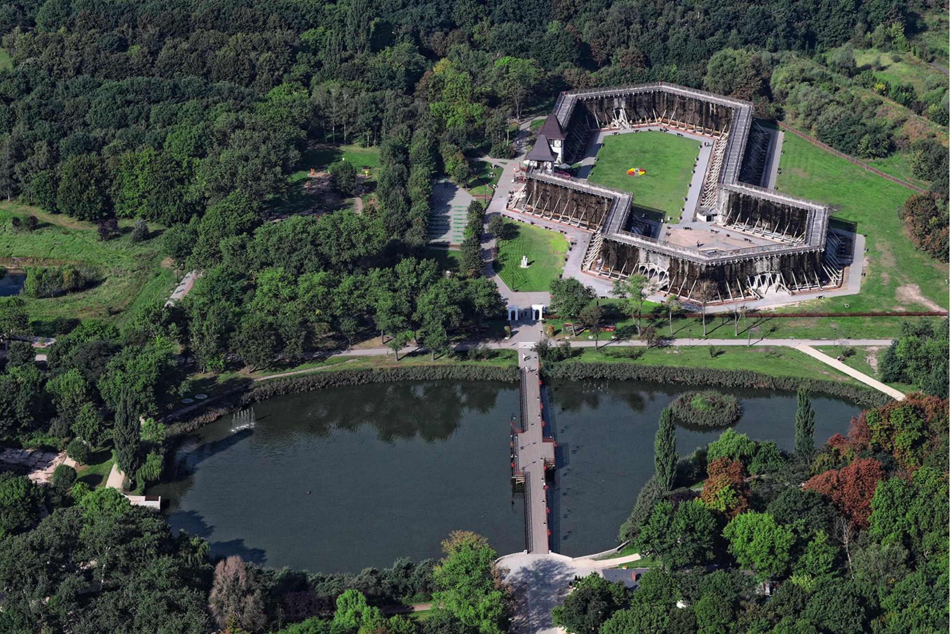
Teznie z lotu ptaka w Inowrocławiu