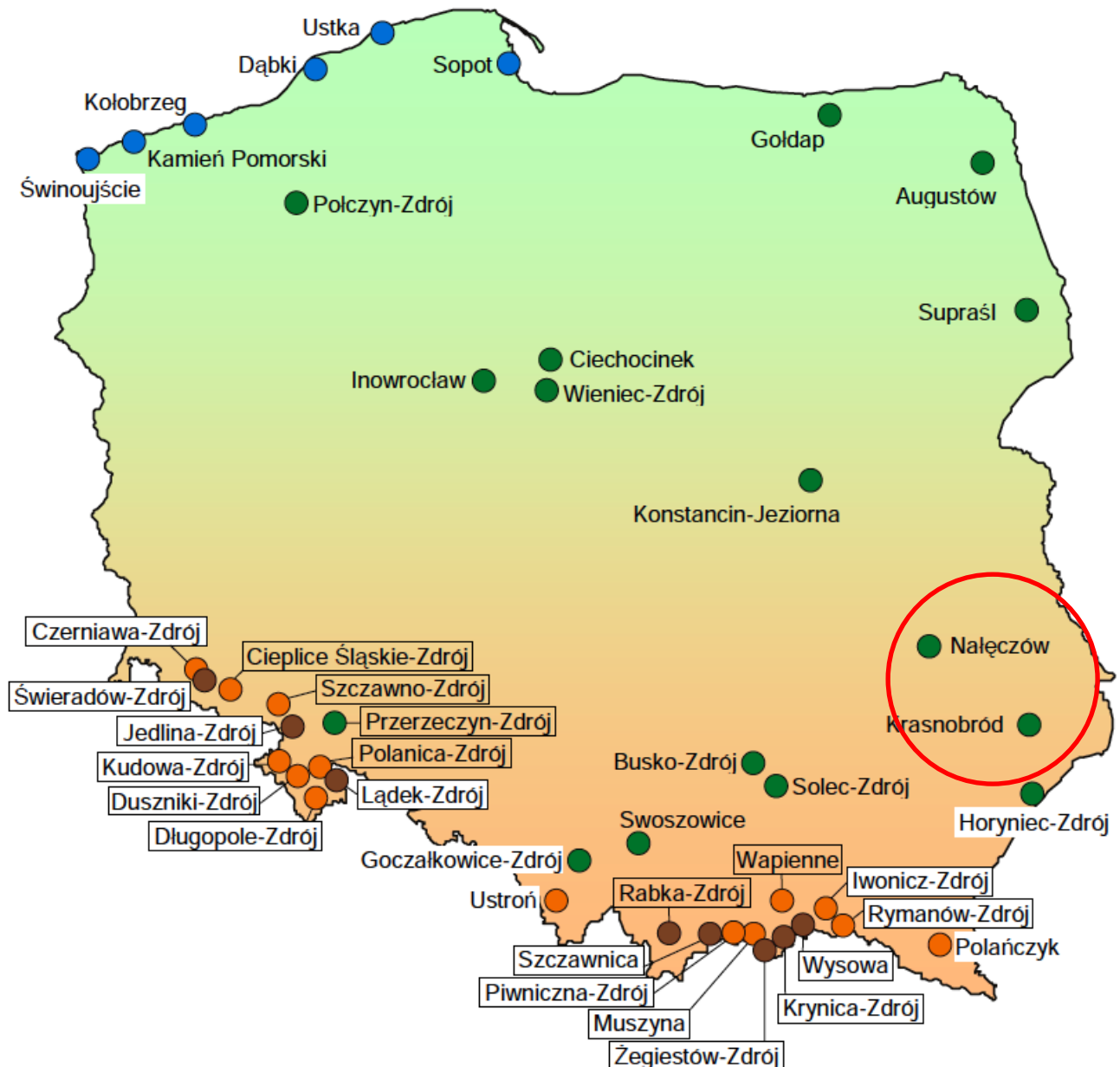
SCHEMAT ROZMIESZCZENIA MIEJSCOWOŚCI UZDROWISKOWYCH