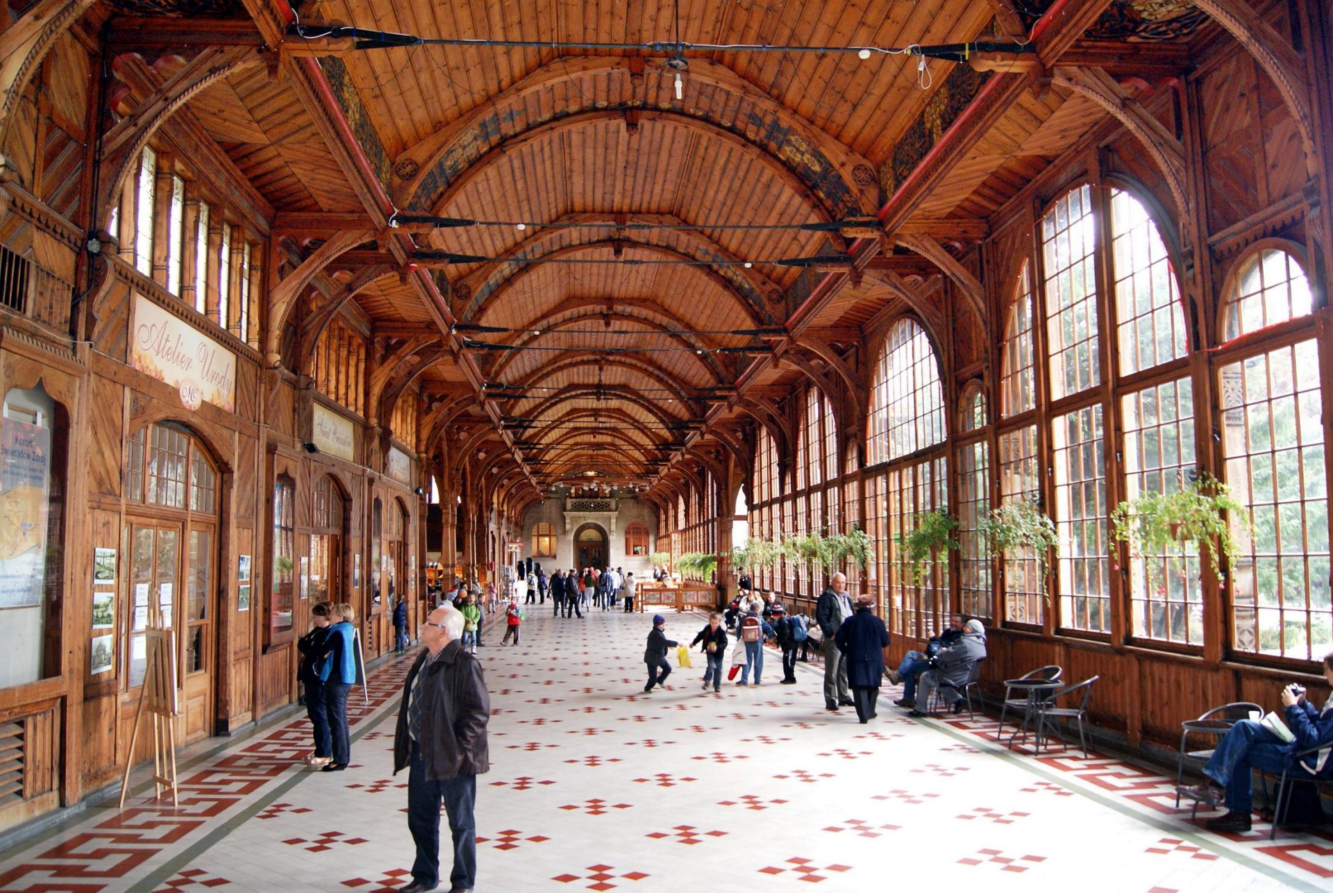
Najdłuższa na Dolnym Śląsku modrzewiowa Hala Spacerowa o długości 80 m, z piękną roślinną polichromią i witrażami