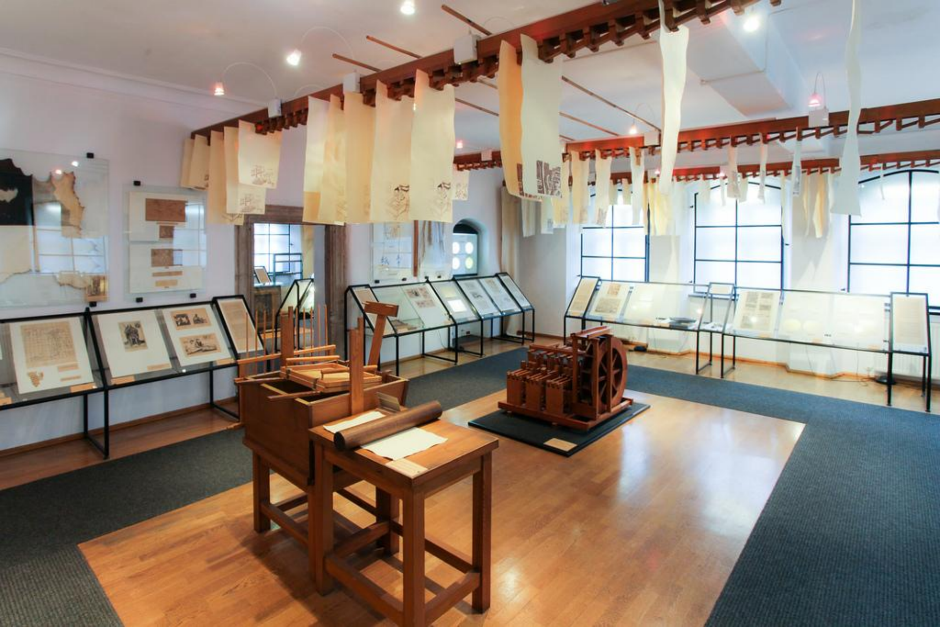
Muzeum papiernictwa w Dusznikach