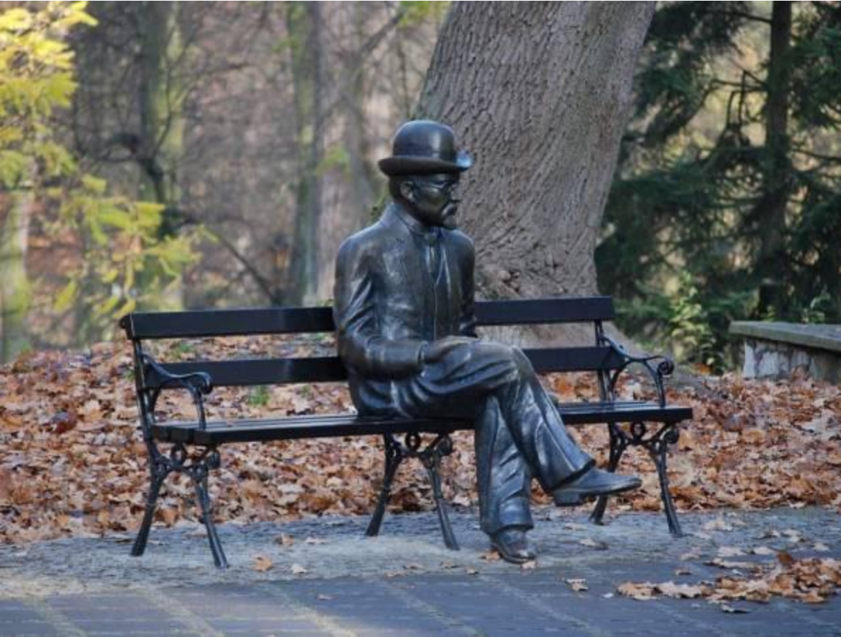
Ławeczka Bolesława Prusa

Nałęczów , położony na terenie Kazimierskiego Parku Krajobrazowego, jest jednym z najbardziej romantycznych miejsc w Polsce. Przebywała tu elita polskiej literatury z Żeromskim i Iwaszkiewiczem na czele. Niezwykły bioklimat tego miejsca samoczynnie obniża ciśnienie tętnicze oraz zmniejsza dolegliwości chorób serca.