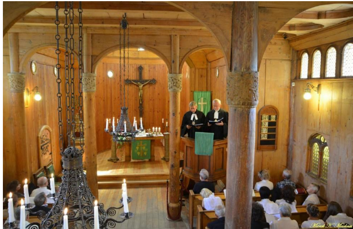
Parafia Ewangelicko-Augsburska Wang w Karpaczu

Pierwotnie kościół został zbudowany na przełomie XII i XIII wieku w południowej Norwegii, w miejscowości Vang . W XIX wieku obiekt został kupiony przez króla pruskiego Fryderyka Wilhelma IV i przewieziony w częściach do Prus. W latach 1842-1844 Świątynia Wang została z powrotem wzniesiona w Karpaczu. Kościół zbudowany jest z sosny norweskiej, nasączonej żywicą. Ciekawostką jest to, że konstrukcja kościoła wykonana jest bez użycia gwoździ, wszystkie połączenia zrealizowano przy pomocy drewnianych złączy ciesielskich.