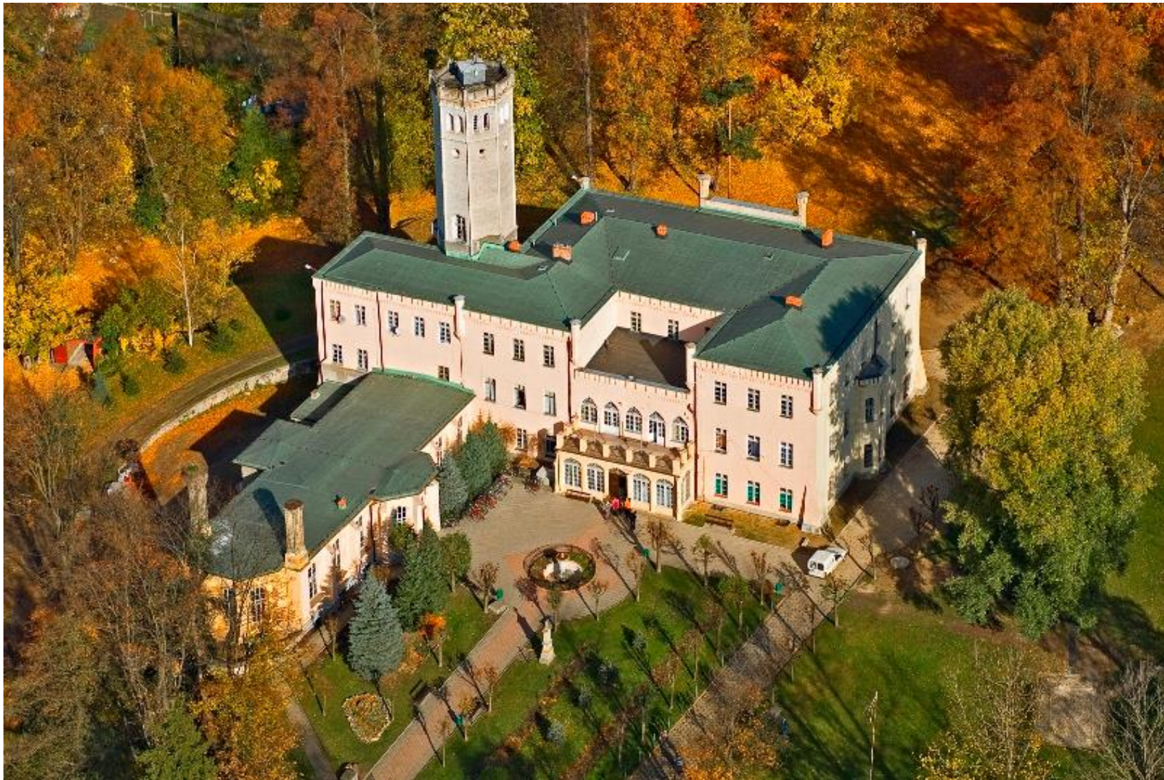
Pałac Królewski w Mysłakowicach