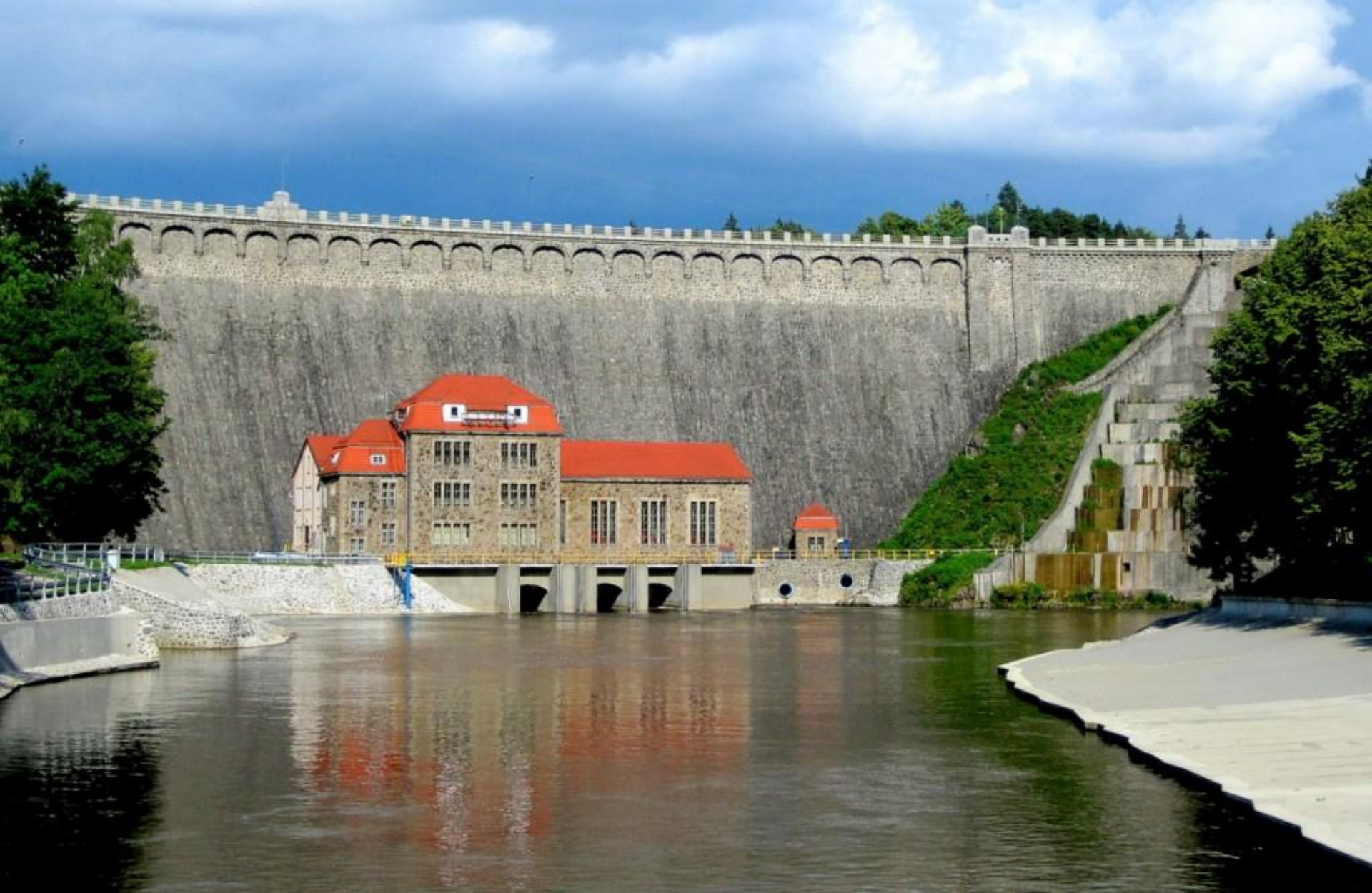
Zapora Pilchowice – druga co do wysokości (po Solinie) i druga co do czasu powstania zapora wodna w Polsce